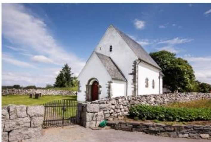
TALGE KYRKJE.

Finnøy kyrkjelege fellesråd har også søkt om støtte på kr 20 000,- til kjøp av brostein til ferdigstilling av uteområde ved Fogn kyrkje, eit investeringsprosjekt som tilsamen kostar om lag kr 190 000. Arbeidet vert gjort på dugnad. Rådmannen viser til at driftstilskotet frå Finnøy kommune til Finnøy kyrkjelege fellesråd utgjer kr + 258 000,-. Såleis er kr 20 000,- eit lite beløp, og rådmannen rådar Finnøy kyrkjelege fellesråd til å sjå om ein kan sette av midlar til ferdigstilling av uteområdet ved Fogn kyrkje frå driftsbudsjettet.